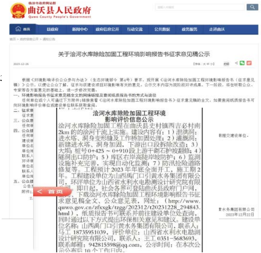
图 3.2.2-1 环评第二次公示报纸公示截图（2024 年 1 月 1、4 日报）